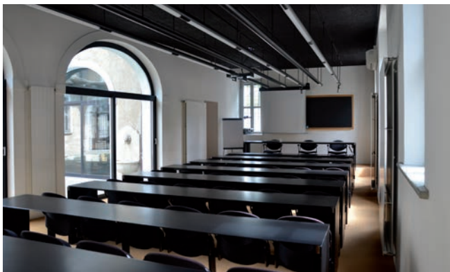
Aula 2* è dotata di 48 posti a sedere, la sua superficie è di 63 mq.