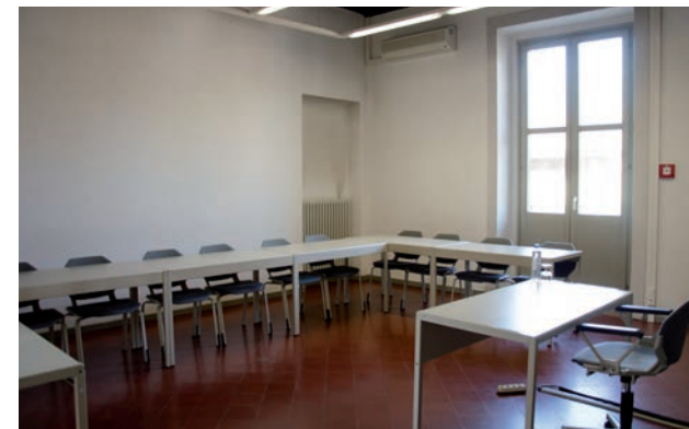
Aula 111 è dotata di 16 posti a sedere, la sua superficie è di 35 mq.