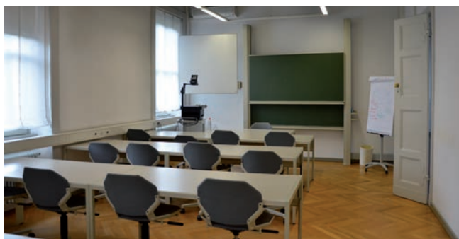
Aula 106 è dotata di 22 posti a sedere, la sua superficie è di 48 mq.