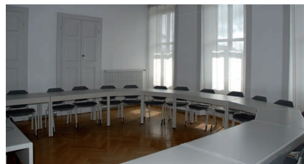
Aula 113 è dotata di 18 posti a sedere, la sua superficie è di 42 mq.