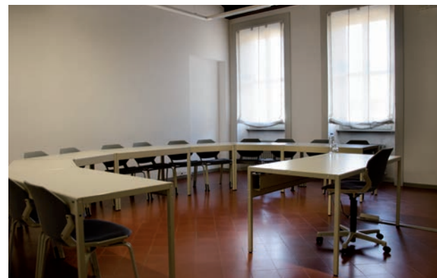
Aula 110 è dotata di 14 posti a sedere, la sua superficie è di 35 mq.