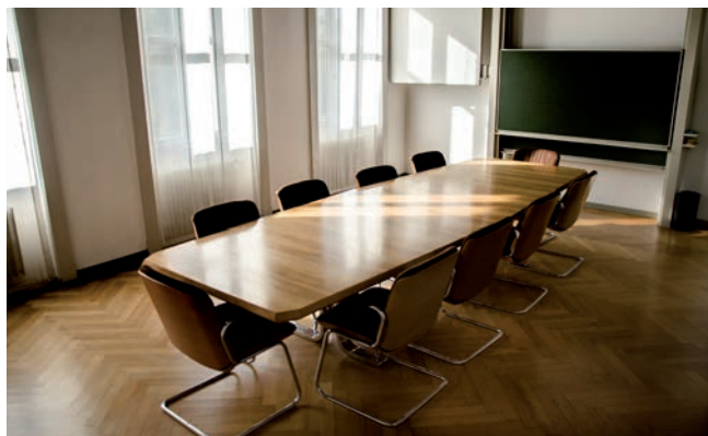
Aula 103 è dotata di 10 posti a sedere, la sua superficie è di 32 mq.