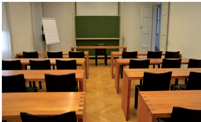
Aula 104 è dotata di 20/30 posti a sedere, la sua superficie è di 41 mq.