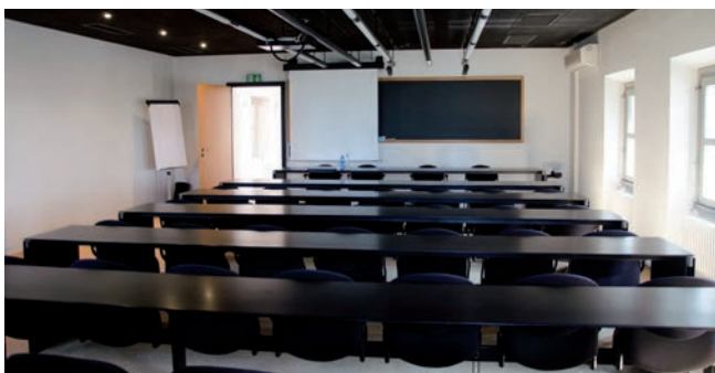
Aula 3 è dotata di 36 posti a sedere, la sua superficie è di 58 mq.